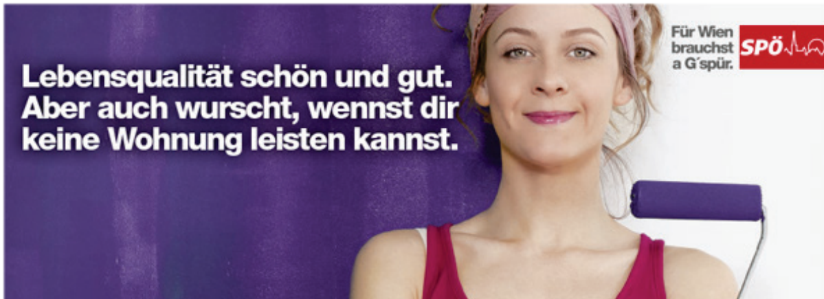
Wahlplakat der Wiener SPÖ im Wahlkampf Sommer/Herbst 2015

The quality of life must be in the eye of the beholder. (Campbell, Angus / Converse, Philip E. (1972): The Human Meaning of Social Change . New York. S. 442)